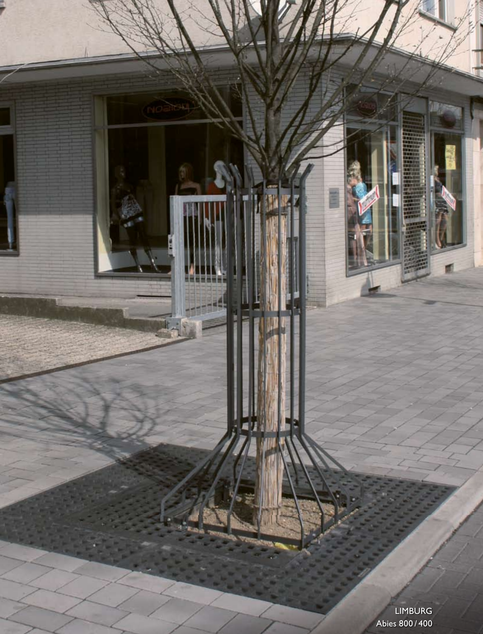
LIMBURG Abies 800 / 400