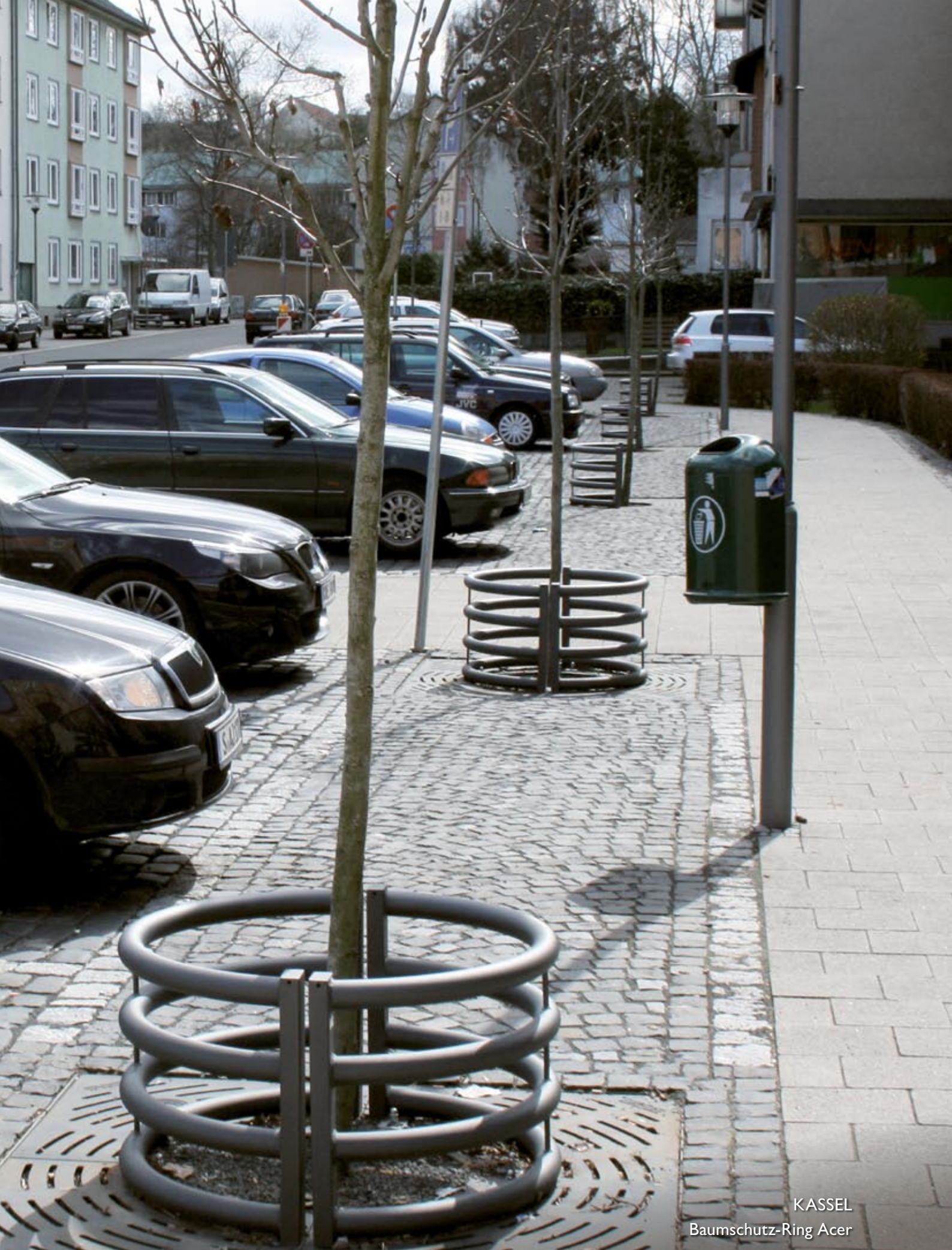
KASSEL Baumschutz-Ring Acer