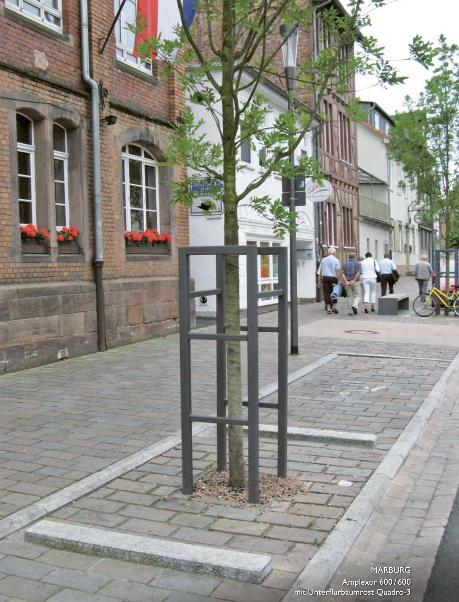
MARBURG Amplexor 600/600 mit Unterflurbaumrost Quadro-3