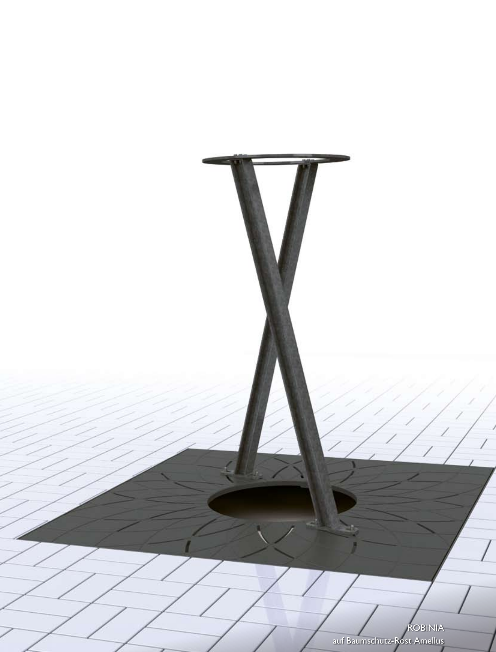
ROBINIA auf Baumschutz-Rost Amellus