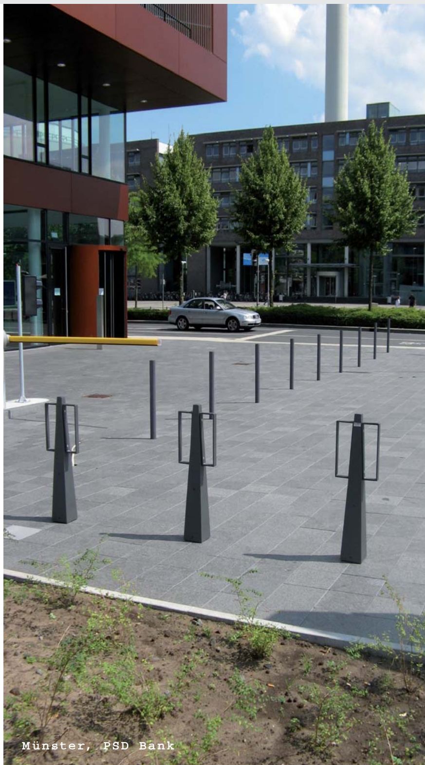
Münster, PSD Bank